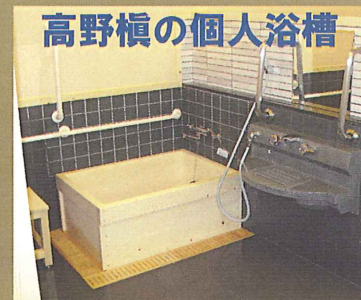
高野槇の個人浴槽